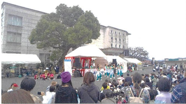
～昨年開催時の様子～